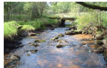
Pont planche du ruisseau de Haute-Faye