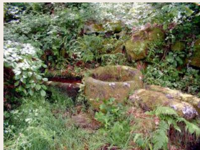
Fontaine de Beaubier

tives, valables autant pour la fièvre que pour les maladies cutanées.